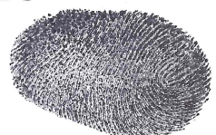
RODOLFO CABALLERO VALDES